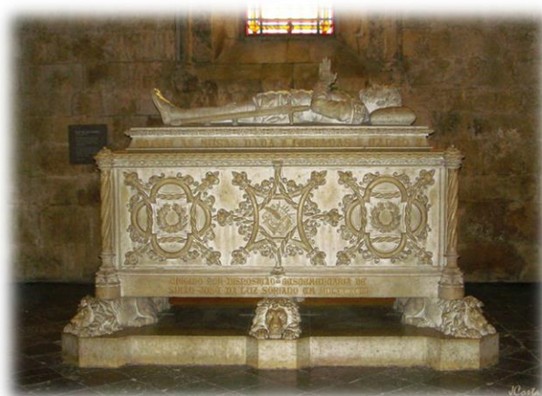
Atual túmulo de Camões

E, apesar das grandes honras que se lhe fizeram depois, erigindo-lhe um túmulo ao lado dos de Vasco da Gama e D. Sebastião, no momento de sua morte não teve ele enterro nem ataúde. O corpo desse grande poeta, maior que todos, foi jogado entre outros corpos, em vala comum, pois era tempo de peste, e morria muita gente. Os ossos hoje enterrados em sua tumba, no Mosteiro dos Jerônimos, são misturados de muitas pessoas, e foram tirados do local onde se estima tenha sido jogado o valioso cadáver: supôs-se que o poeta estava ali no meio. Se vemos nisso algo de dramático, há também uma verdade profunda: que o destino de Camões é o do povo português inteiro, como diz o seu poema, que não canta (como Virgílio) um só herói, no singular, mas a pluralidade de uma nação: as armas e os barões assinalados .