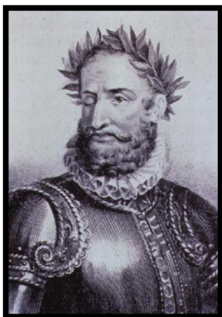
Retrato de Luís de Camões

De fato, o maior dos poetas da língua portuguesa é quase que o oposto do estereótipo. Primeiro, porque de franzino nada tinha: era de tal modo truculento e arruaceiro, que o chamavam Diabo e Trinca-Fortes . Aos vinte e dois anos o exilaram da Corte, por crime hoje desconhecido; aos vinte e oito, foi preso por esfaquear um servidor do Paço em dia de Corpus Christi ; desde então, morou em África, Índia e China, sendo periodicamente preso ou expulso por arranjar confusões as mais variadas. Embora tivesse vocação de poeta, sua carreira foi militar, e por ela perdeu um dos olhos, em ataque de piratas mouros, aos vinte e três anos de idade. Como se vê, seu temperamento era forte: eu arriscaria classificá-lo como colérico-sanguíneo.